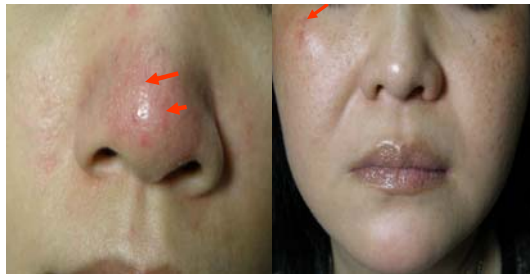
脈衝光治療花柳部長級 薪水，鼻頭紅斑、毛細 血管擴張、充血紅通通 似「小丑鼻子」