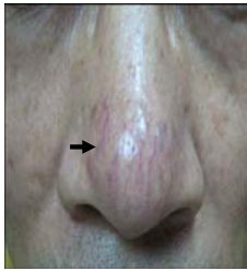
毛囊口擴大，毛細血管擴 張，縱橫交錯