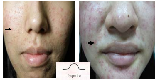
類固醇酒糟，停藥反彈，突冒出丘 疹、臉乾燥、脫皮