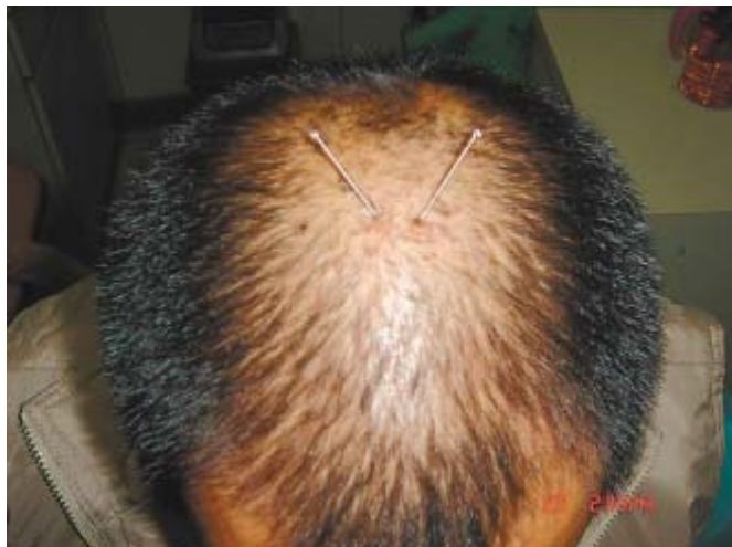
圖 1：頭皮針。