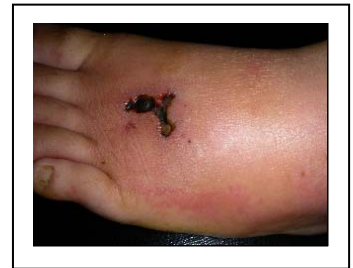
(傷口引起的蜂窩性組織炎)。