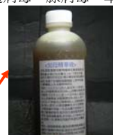
(知母甘草萃取精華液)