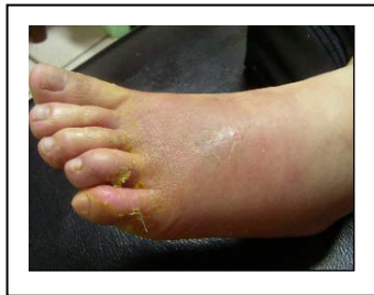
(香港腳引起的蜂窩性組織炎)。

蜂窩性組織炎，坊間名為<紅腳紅>，意謂其發病的第3~5天，患部的組織會比先前的患部更紅、更腫，此時也就是疾病急性巔峰期。