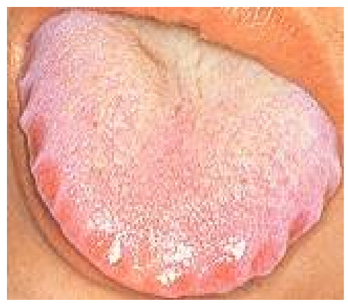
舌體邊緣有牙齒壓迫的痕跡，稱為齒痕舌或齒印舌