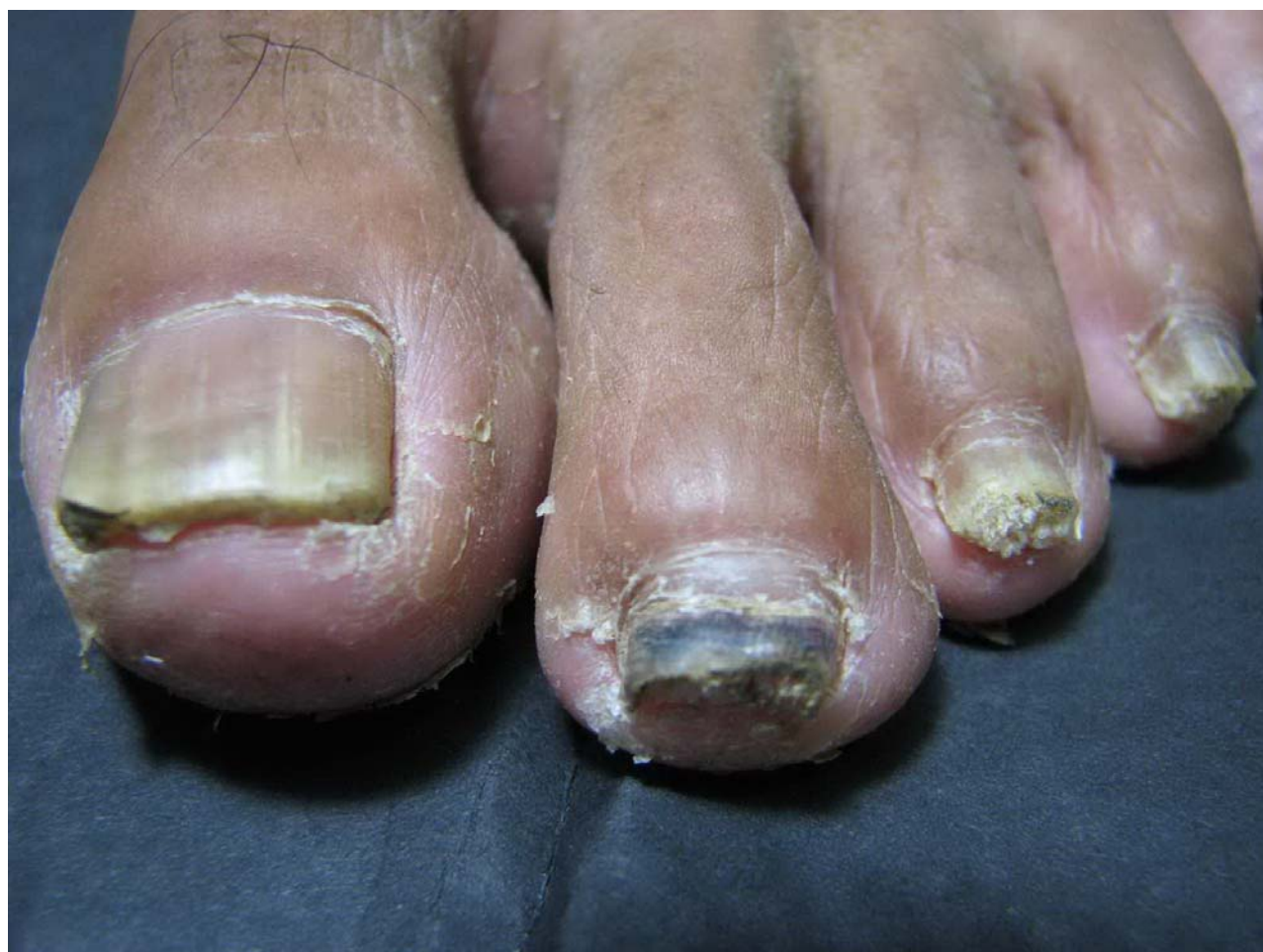
. 趾甲失去光澤，增厚變黃、變白、變黑

佐與消炎排毒的〈大黃〉，則用藥上乃可去蘆存菁而爐火純青，在臨床驗證上才有辦法過關斬將、剋敵致勝。所以我們在治療任何自體免疫系統失調的問題，例如：僵直性脊椎炎、紅斑性狼瘡、類風濕性關節炎、痛風、甲狀腺亢奮或低下，乾燥症、糖尿病等等，我們只要用〈科學精製漢藥〉的〈黃芩粉、黃連粉、大黃粉、甘草粉〉與〈知母萃取精華液〉及〈苦參圓〉，將使許多免疫系統的疾病可以從根本改善體質，亦可避免西藥治標不治本導致千瘡百孔的後遺症，所以，當我們擺脫中西醫一言堂的思想嵌制和洗腦教育，不再道聽途說或補風捉影，我們的〈〈新漢醫學〉〉將不再坐困愁城而且大刀闊斧、令人耳目一新，才可以讓許多疑難雜症迎刃而解，也才得以百花齊放。